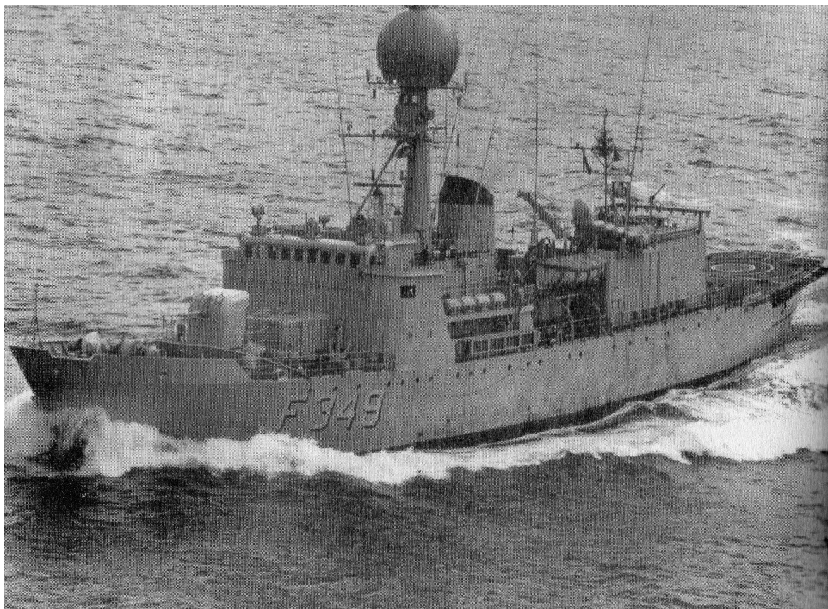
”Vædderen” 72 metur langur, 11,5 metur breiður, stingur 5 metur, 1500 tons stórir. Byggjuár 1963.

Andersen skipari gav beinanvegin boð um at gera klárt at sigla.